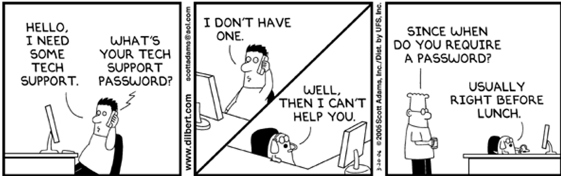
© Scott Adams, Inc./Dist. by UFS, Inc.